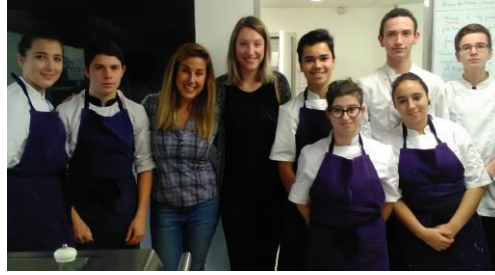
Classe de CAP1 avec les adultes invités

Des temps de partage sur les migrations entre les élèves et des personnalités issues des pays européens (Grèce, République tchèque, Angleterre...) ont permis la mise en valeur des échanges humains.